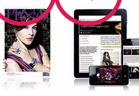
OpenTresor.com - Bespoken World® Topics, Experiences, Assets & Insides