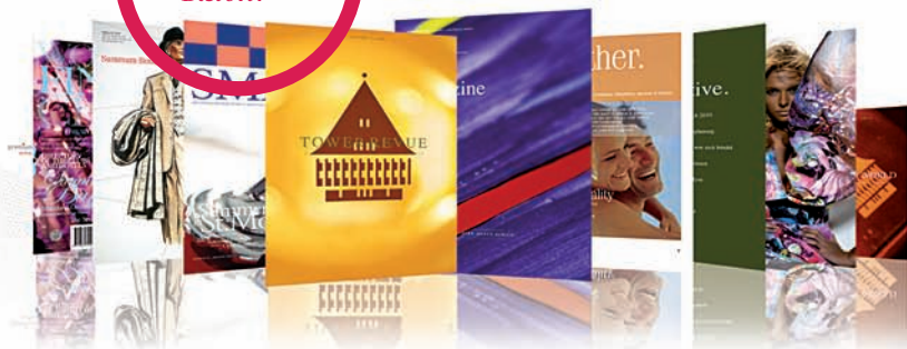
OpenTresor.com - Bespoken World* Topics, Experiences, Assets & Insides