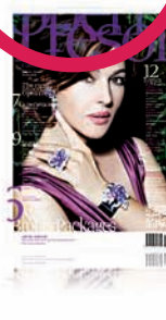
CoreMagazine® Tresor Integrated Cross Media Strategy