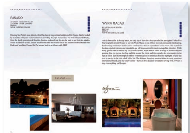
Free PR presentation of all the Member-Clubs in the World